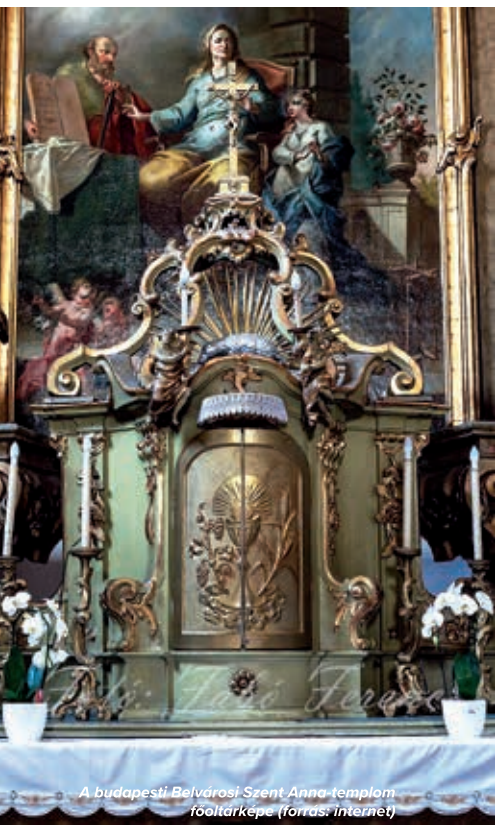
A budapesti Belvárosi Szent Anna-templom főoltárképe

Ábrahám áldozatánál olvashatunk róla, amikor az Úr próbára teszi hűségét azt kérve, hogy áldozza fel fiát, Izsákot. A bokrok között talált kos menti meg Izsák életét. (1Móz1-14). A hagyomány szerint Ábrahám Niszán 14-én mutatta be áldozatát. Niszán a zsidóknál különleges hónap volt: Isten ebben a hónapban teremtette a világot, az ósatyák ekkor születtek, Izrael királyai ettől a hónaptól kezdték uralkodásukat. Ez a nap a zsidó húsvét ün-