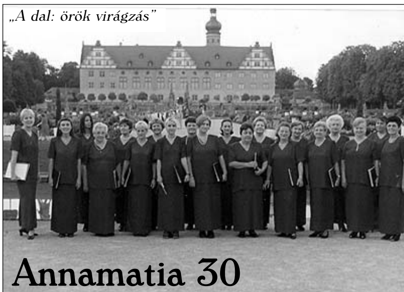
„A dal: örök virágzás”