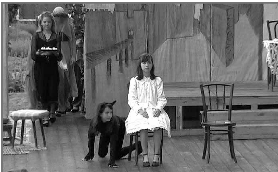
A Szaffit június 19-én ismét műsorra tűzik