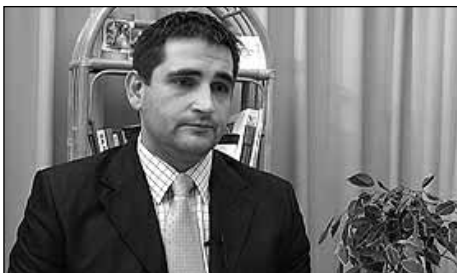
Kiss Lajos Csaba

A honlap színvonalát mutatja, hogy útvonaltervezőt, programterveket, a polgármesteri hivatalok és okmányirodák elérhetőségét, nyitvatartási idejét, a civil szervezetek adatait is tartalmazza majd. Kisfilmeket is készülnek forgatni a 14 település látványosságairól, amelyeken a polgármesterek kalauzsolnák végig a honlapra látogatókat.