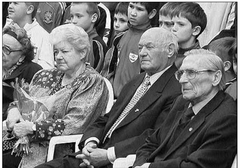
özv. Puskás Ferencné, Buzánszky Jenő, Grosics Gyula