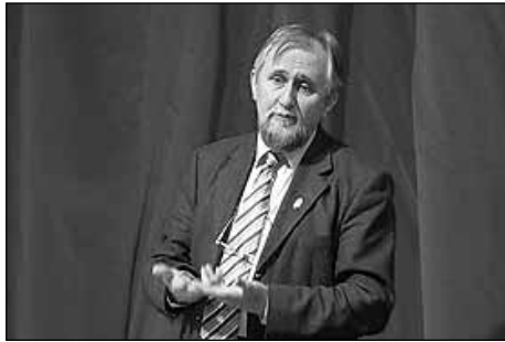
Dr. Árgyán József

Piacot veszített és kiszolgáltatottá vált az agrárszféra – állította Árgyán professzor. Ezek a válság már közvetlenül tapasztalható következményei. A problémák kezelése természetesen beavatkozást, kormányzati támogatást igényel. Az unióban hosszú évek óta jól működik az agrártámogatási rendszer, ez a válságok esetében is hatékony. Az uniós agrárpolitika gazda- és vidékbarát. Magyarországon ez nem így működik – fejtette ki a professzor a véleményét. Beszélt arról is, hogy sok a probléma az uniós források elosztásával. Míg más or-