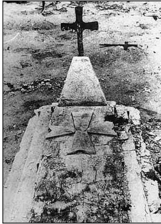
Magyar László feltételezett sírja