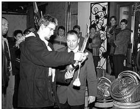
A „lefejezés” mozdulata

A tájékoztató után kezdődött a kóstolás, amelynek volt egy érdekes és látványos momentum. A pince előtt a szabadban mutatták be, miként kell pezsgősüveget nyitni karddal. A műveletnek van fortély, amelyet mindenki elsajátíthat, a vendégek közül többen vállalkoztak a mutatványra,